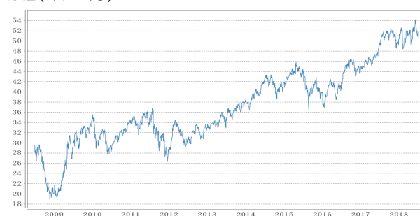
摩根台灣增長證券投資信託基金 淨值 (單位：元)